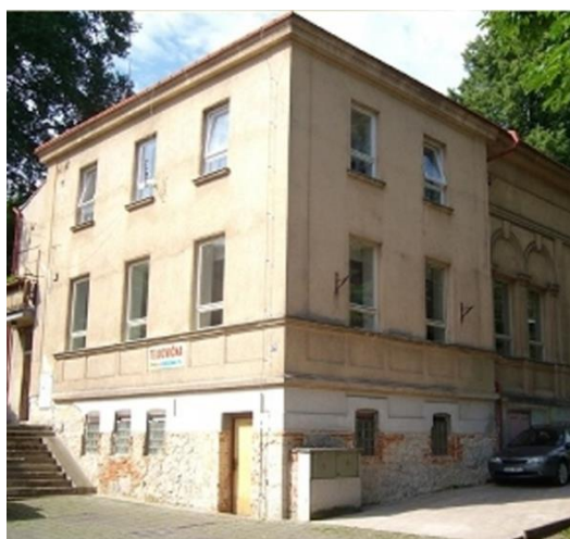
objekt místní sokolovny