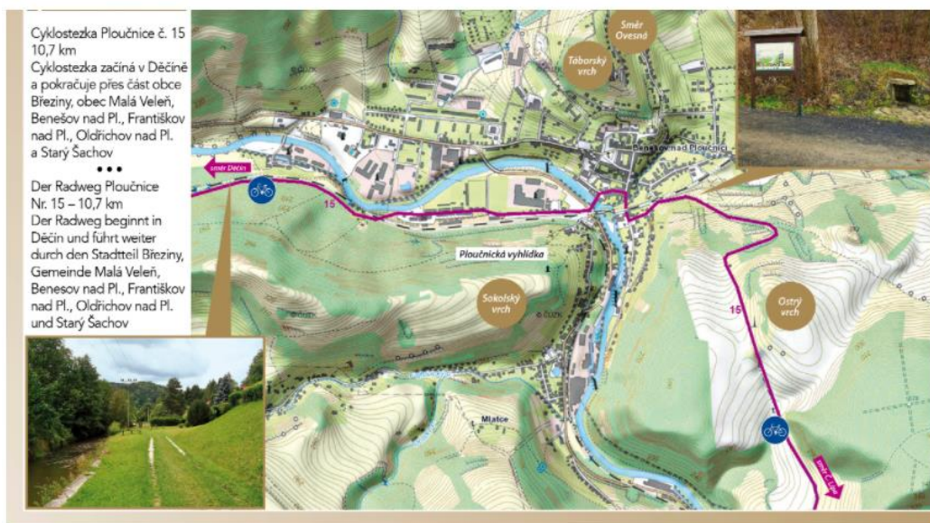
Cyklostezka Ploučnice je dle nomenklatury KČT evidována pod číslem 15

Cyklotrasa v úseku Děčín - Benešov nad Ploučnicí nevykazuje výrazné terénní převýšení. Z Benešova n. Pl. stoupá poměrně strmě pod vrch Ostrý (vrchol 300 m n. m.) tj. cca 180 výškových metrů. Dále klesá směrem k řece a v trase do Starého Šachova kopíruje mírně zvlněný terén.