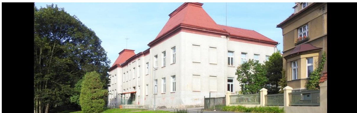
Tělocvična v ZŠ Komenského